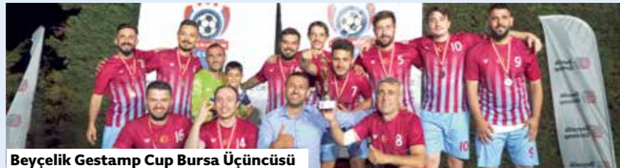
Beyçelik Gestamp Cup Bursa Üçüncüsü