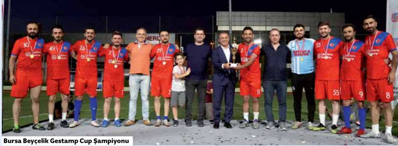
Bursa Beyçelik Gestamp Cup Şampiyonu