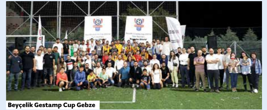
Beyçelik Gestamp Cup Gebze