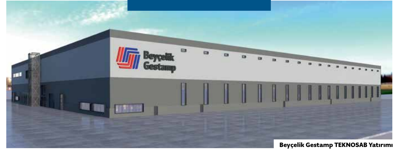
Beyçelik Gestamp TEKNO SAB Yatırımı