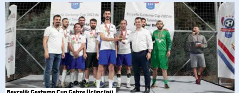
Beyçelik Gestamp Cup Gebze Üçüncüsü