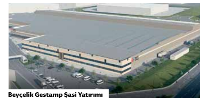
Beyçelik Gestamp Şasi Yatırımı

Beyçelik Gestamp hâlihazırda 4 bin kişiye istihdam sağlıyor. Şirket 2023 yılına kadar yurtiçi ve yurtdışında gerçekleştireceği yeni tesis yatırımları ile üretim kapasitesini artırırken, 1.650 kişiye de yeni istihdam yaratacak.