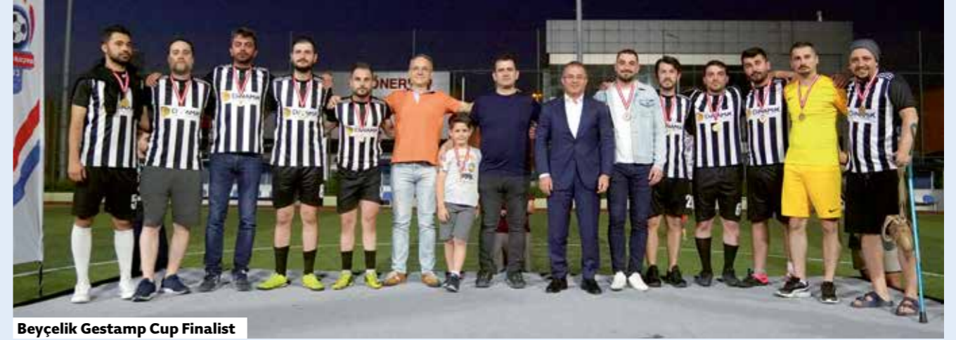
Beyçelik Gestamp Cup Finalist