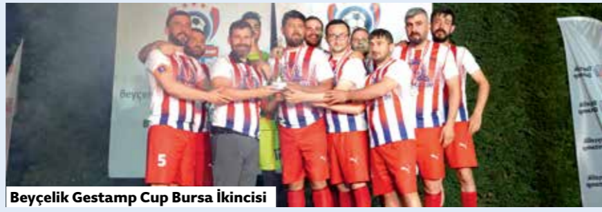
Beyçelik Gestamp Cup Bursa İkincisi