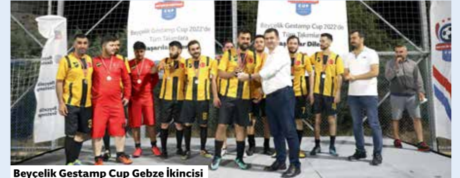
Beyçelik Gestamp Cup Gebze İkincisi