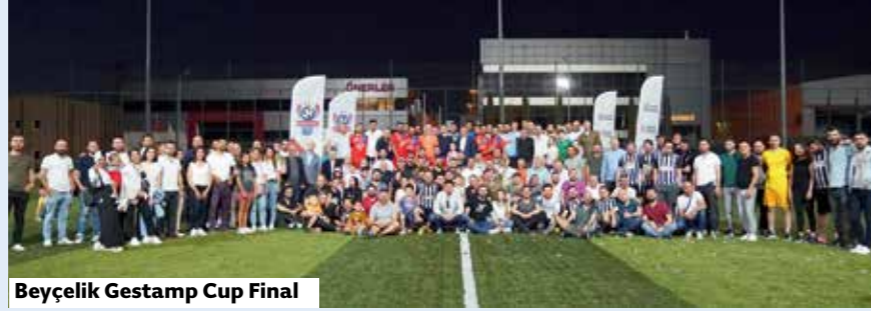
Beyçelik Gestamp Cup Final

Yoğun bir katılımı tamamlanan finaller ardından şampiyonu belirlemek için Gebze ve Bursa'da şampiyonluk maçı yapıldı. Bursa birincisi Son Bükücüler, Gebze ve Bursa'da yapılan her iki şampiyonluk maçında da BGC Prag'ı 2-1 mağlup ederek Beyçelik Gestamp Cup'ın şampiyon takımı oldu.