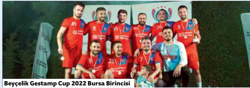
Beyçelik Gestamp Cup 2022 Bursa Birincisi