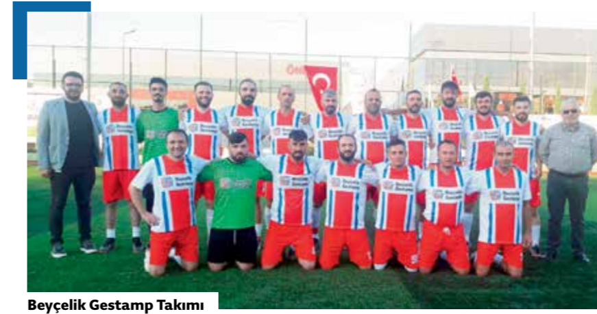
Beyçelik Gestamp Takımı