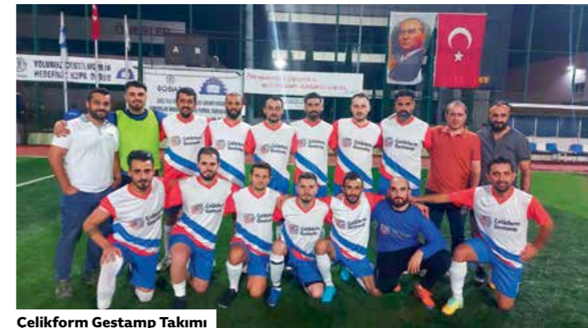
Çelikform Gestamp Takımı