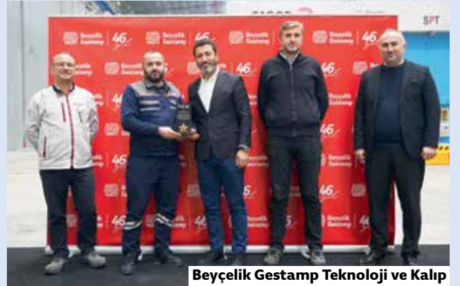
Beyçelik Gestamp Teknoloji ve Kalıp