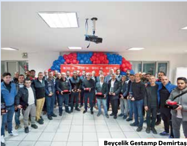
Beyçelik Gestamp Demirtaş

Gastro Teras'ta yapılan etkinlikte ise 20 yıl ve üzeri kıdeme sahip çalışanların ödülü takdim edildi. Yirmi yıl kıdeme sahip 68 kişiye, 25 yıl ve üstü 26 kişiye, 30 yıl ve üstü 5 kişiye ödül verildi. Çalışan ödüllerini Beyçelik Holding Yönetim Kurulu Başkanı Faik Çelik ve Beyçelik Gestamp Yönetim Kurulu Başkanı Baran Çelik'ten aldı.