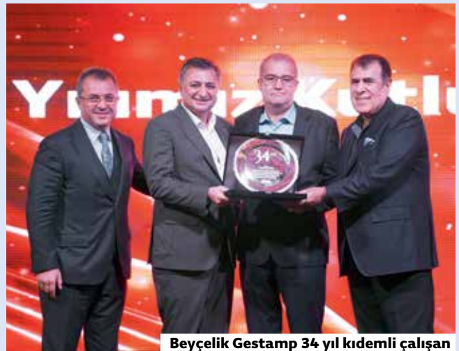
Beyçelik Gestamp 34 yıl kıdemli çalışan