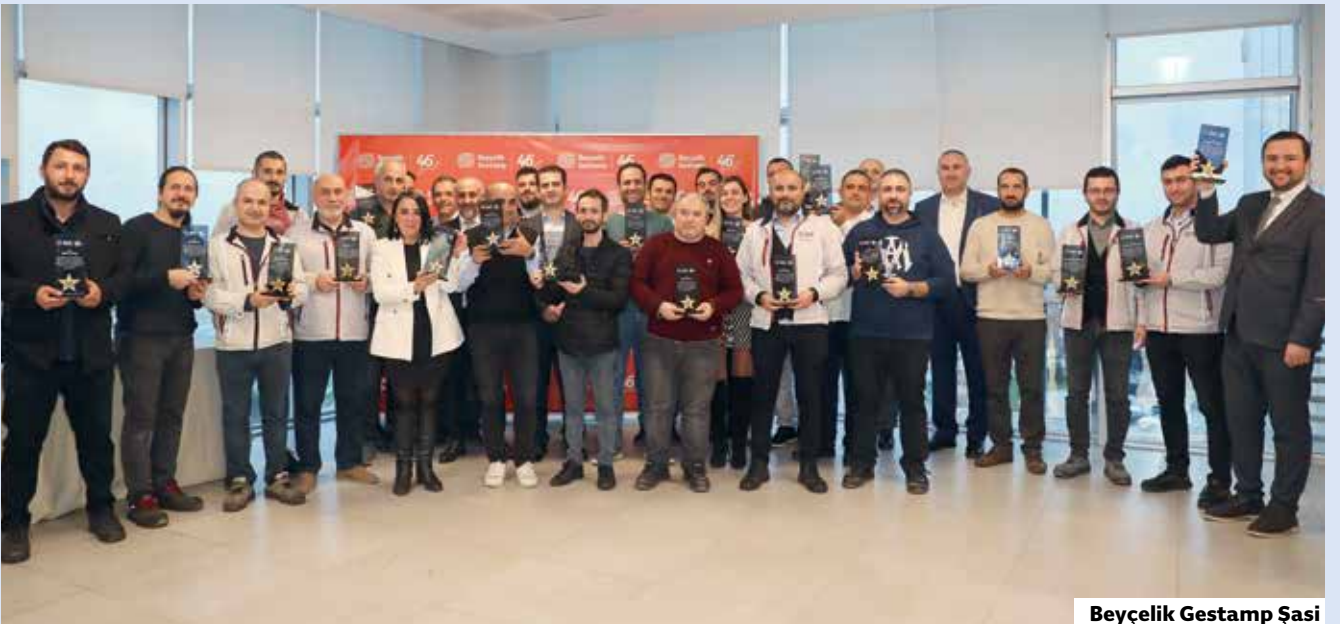
Beyçelik Gestamp Şasi