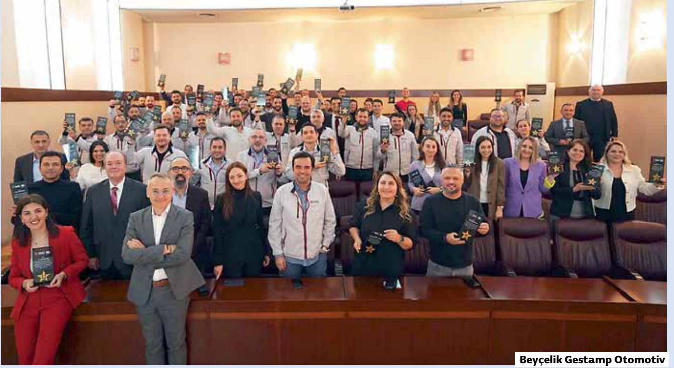
Beyçelik Gestamp Otomotiv