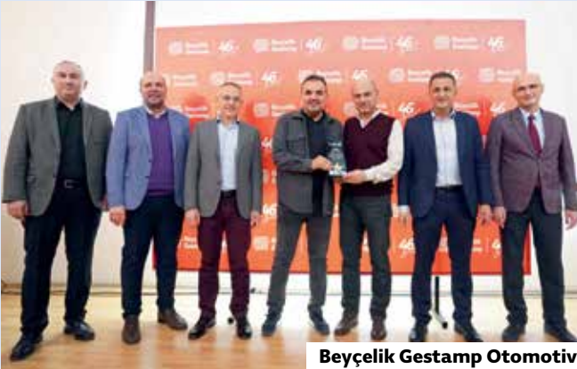
Beyçelik Gestamp Otomotiv